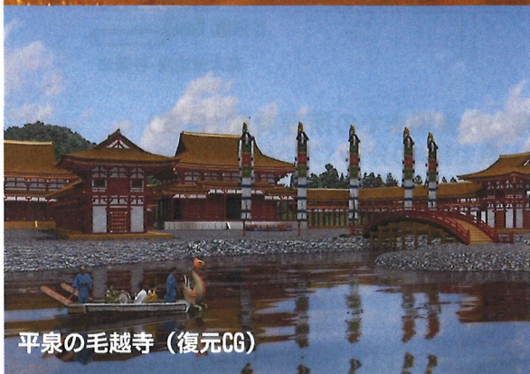
平泉の毛越寺（復元CG）