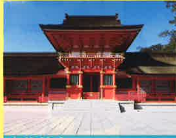
宇佐神宮うさきんぐう