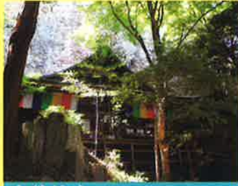
文殊仙寺もんじゅせんじ

国東半島の中心にある六郷満山寺院で、開基は養老2年(718)仁聞菩薩によるもの。山門に安置されている仁王像は国東最大のもので、