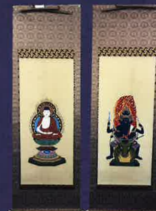
お砂踏みでお祀りされる掛け軸です