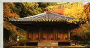
富貴寺(国宝)【滞在時間】60分