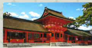
宇佐神宮(国宝)【滞在時間】50分