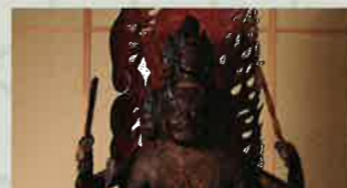
真木大堂【滞在時間】20分