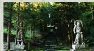
両子寺【滞在時間】35分