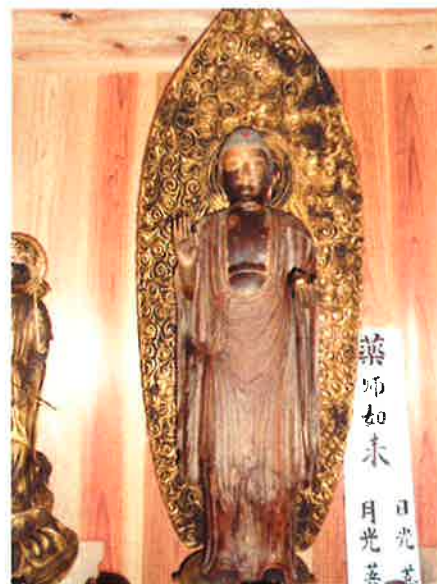
東光寺薬師如来像（非公開）