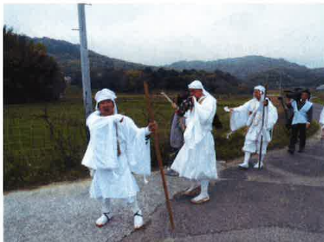
横城より降りる修験僧