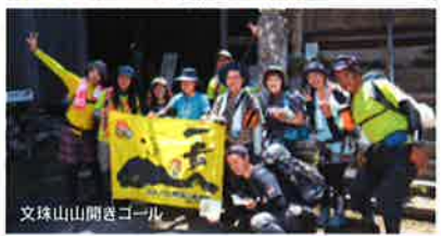
文珠山山開きゴール

※山開きには、国東市観光協会募集ツアーを実施/バスツアーは、山開きより30分遅れのスタートとなります。