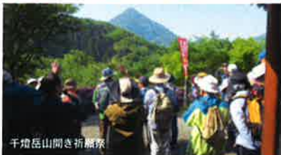
千燈岳山開き祈願祭