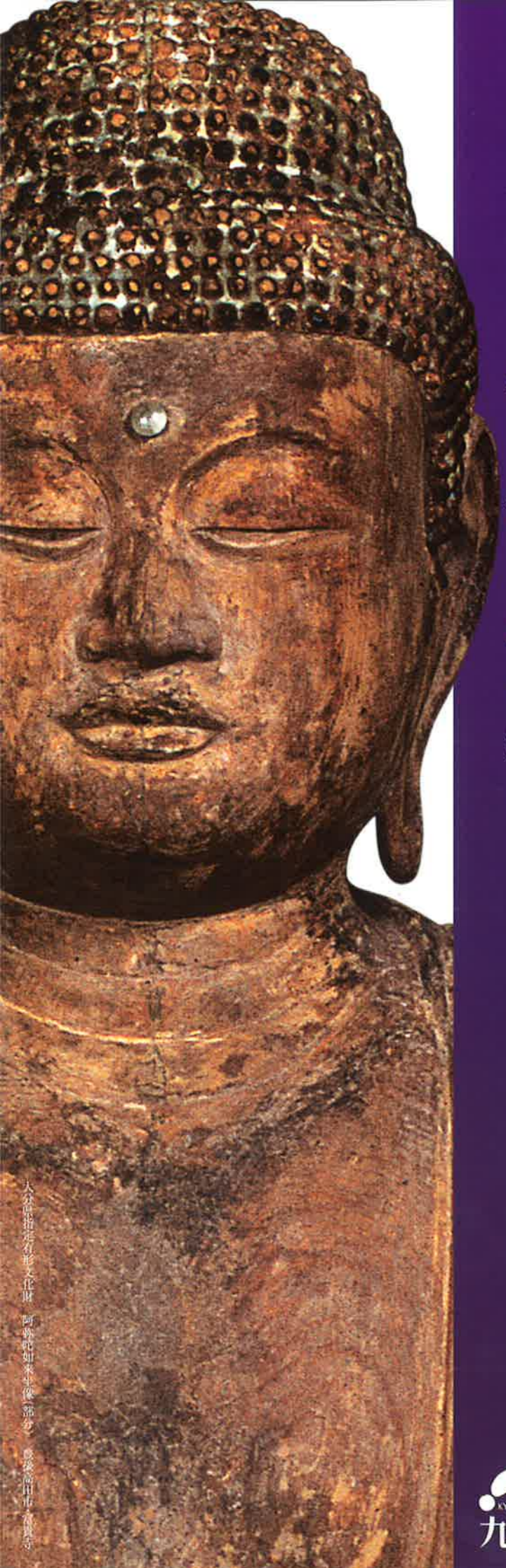
大分県指定有形文化財 阿蘇陀如来坐像(部分) 豊後高田市・高良寺