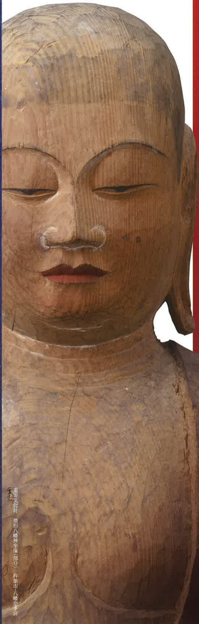
重要文化財 曾形八幡神坐像(部分) 杵築市・八幡奈多寺