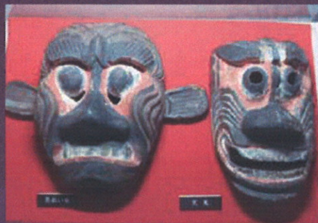
峨眉山 文殊仙寺(鬼会面)