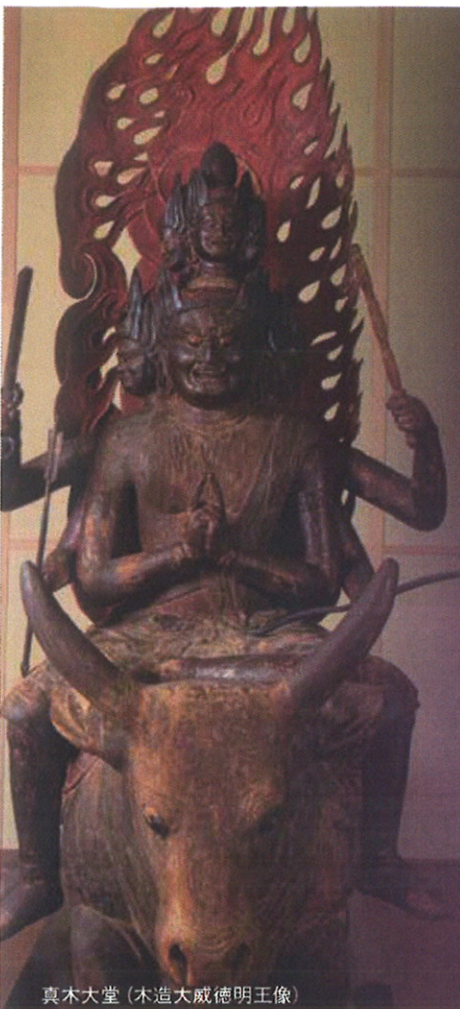
真木大堂(木造大威徳明王像)

【お問い合わせ】宇佐国東半島を巡る会 事務局 TEL.0978-73-0300 FAX.0978-73-0128