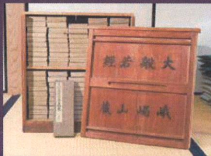
峨眉山 文殊仙寺(大般若経)