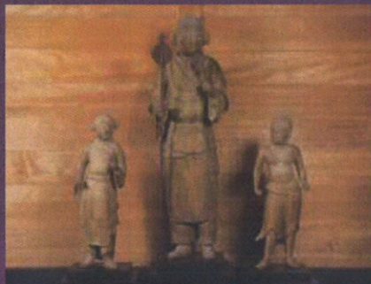
金剛山 長安寺(太郎天像)