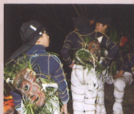
鬼役の子どもたち