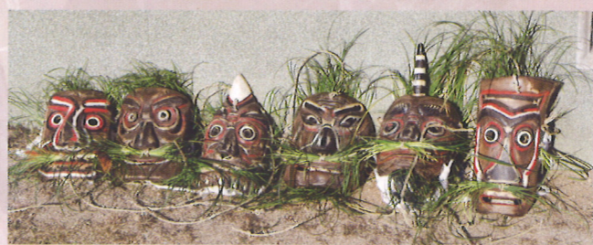
子供修正鬼会の面。上段は平成23年から使われているもの。下段はそれ以前に使われていたもの。

丸小野の子供修正鬼会でも鬼の役割は変わりません。子供鬼会では6人の鬼が登場し、松明をかざして参拝者を加持する「災払」を行います。さらに加持の輪に入れなかった参拝者のために「悪魔払」として、足元を松明であぶって無病息災を祈願します。