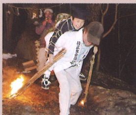
鬼を背負うタイレ

昔は、これらの役付になるのは座元地区の各家の長男だけで、次男以下や養子は参加できませんでした。